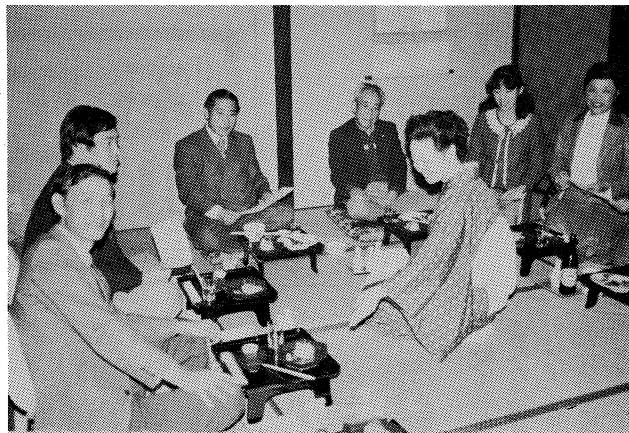
文化部の目玉、第2回食べ歩き会。和田屋で岩魚の骨酒に満喫。会員趣味アンケートが発端。(昭和57年11月20日 鶴来町・和田屋)