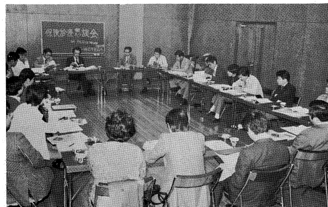
新規開業医を囲んだ保険診療懇談会に31名参加。保険診療の心得から経営対策まで、自由な雰囲気で見聞交換。(昭和53年11月16日、金沢市観光会館)