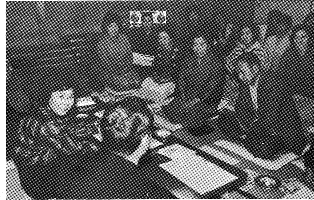
健康なんでも相談が各地で好評。予約さばきに大重(わらわ)。58年度は15回開催。(昭和58年11月22日 犀川農協支所)