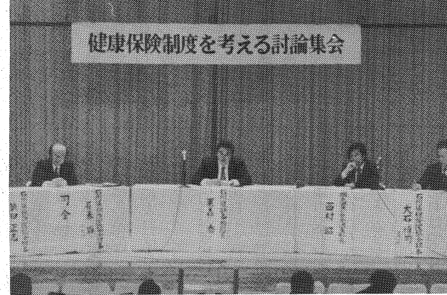
医療保険制度改悪をめぐる討論集会。労働者、患者、医師それぞれの立場から活発な討論。320名の参加。医師への期待と注文が相次ぐ(昭和59年4月19日 石川県教育会館)