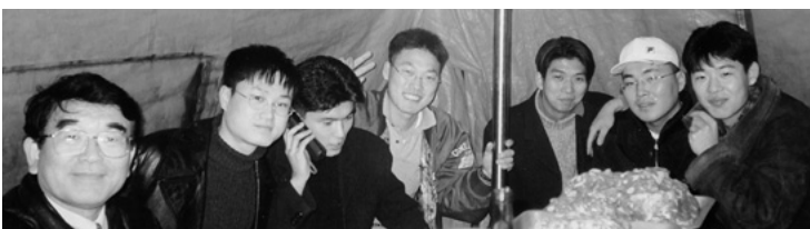
冬の釜山西面付近のポジャンマチャ。東亜大学野球部の学生と盛り上がった。外は厳寒でも幌の中は客の熱気と肴の湯気とアジュモニの陽気で温かい。

ポジャンマチャとは幌張馬車の韓国語読みであるが、文字通り西部劇の幌馬車の幌で覆つた韓国版屋台である。ポジャンマチャは大抵、晴れがましい場所や明るい場所ではなくて、ビールを飲みすぎた時に立ち小便をしたくなるような場所にあるのが普通である。私はホテル横の意外な場所にある、このポジャンマチャに飛び込んだ。