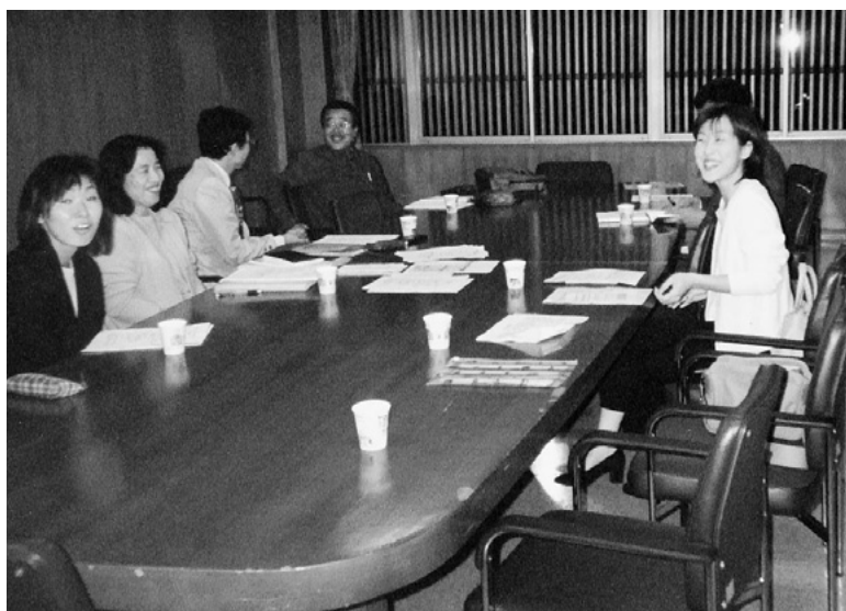
チャイルドライン・いしかわ開設のための準備に取り組むみなさん

「子ども夢フォーラム」は、子どもたちが、夢や希望を持って、二十一世紀を生きていけるよう、心豊かな子どもたちの環境づくりのために「チャイルドライン・いしかわ」の活動を中心に、「子ども」に関する情報・広報活動、セミナーなどを通じ、より良い地域づくり、環境づくりをめざし、一九九九年八月に設立したNPO（非営利活動）の会です。