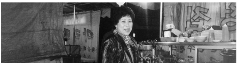
全羅南道光州のポジャンマチャ。一般にアジュモニは情が深くて世話好きである。アジュモニは酒や肴を売るというより客の話相手になったり客同士を結び付けてくれる。

ヨイドには国会議事堂もあるが、このお二人のうちの一人が国会議員であった。一般にポジャンマチャは学生や庶民が集う所なのだが、幌の中では韓国社会の各階層の人々がネクタイを緩めたり外して、肩書きなしの一人として振る舞う。そしてアジュモニの仕切りで互いに上下関係なしに話し合えるのが楽しい。次第にウリの範囲に入る。韓国語会話では盛んにウリと言葉が出てくるが、日本語に大胆に意識すると「うちの」と言っ感じであろうか?ポジャンマチャで約一時間