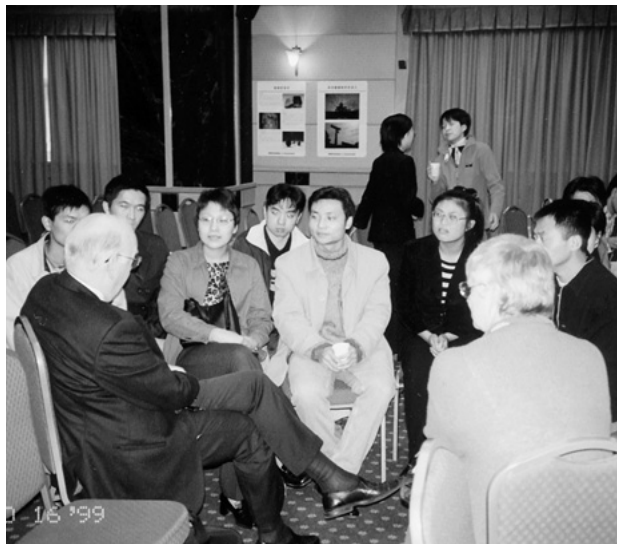
休憩時間にも熱心に話し合う中国の医学生たちと、アメリカ・カナダからの参加者

九条が狙われていると危惧を表明。新ガイドラインは北アジアの非核地帯づくりの障害になっていると厳しく批判。予想以上に最近のわが国の政治動向がリアルに知られており、世界各国で憲法九条の行く末が懸念されていることを痛感した。 閉会式では、核兵器の全面廃絶に向けた取り組みを強調した「北京宣言」が採択され、来年六月二十八日から七月二日までフランスで第十四回世界大会が開催されること紹介された。