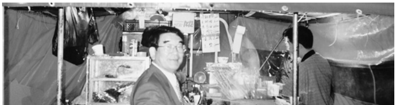
ソウルヨイド・メネトンホテル横のポジャンマチャ。トイレットパーバーに注目。これでカウンターを拭いたり口をぬぐったりする。日本人としては非常に抵抗がある。

そして、先客の二人とも世間話をしながら、肩のこらないゆつくりとした韓国の夜の時間を過ごした。