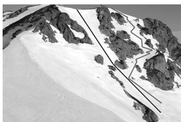
旭岳2867m山頂から滑る2つのルンゼコース (03.6.4)