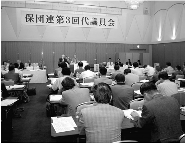
全国から代議員、事務局員ら251人が集った保団連第3回代議員会