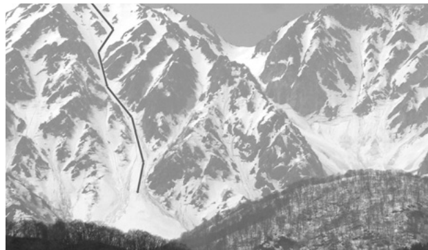
鐘ヶ岳2903m山頂からの中央ルンゼ滑走コース (03.5.14)

ルで自重を促す手紙が多く寄せられた。来シーズンは少し遠慮をしようかと考えるが、シーズンが終わらない内にまた来シーズン用の板を買つてしまった僕は、来シーズンも相変わらず山スキー中毒から抜け出せないかも知れない。