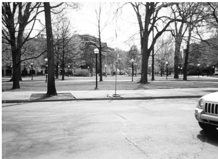
—ミシガン大学の中央キャンパス— 歯学部および付属病院もこの近くにある