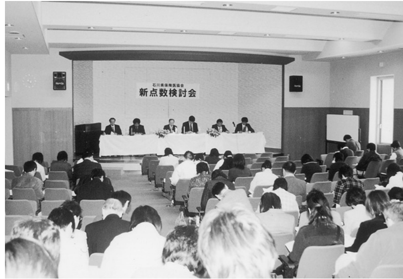
七尾サンライフプラザで開かれた医科新点数検討会 (3月28日)