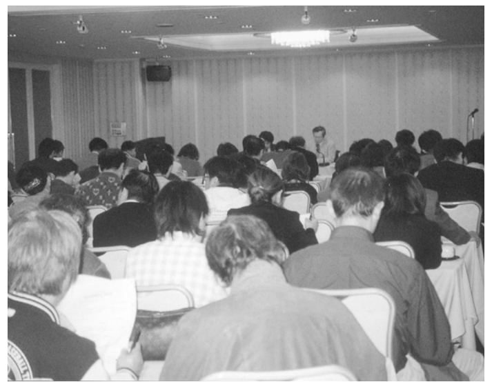
過去最高の参加者となった歯科新点数検討会 (3月24日・金沢都ホテル)

は、今回以上の「抜本改定」があると予想されているが、臨床現場が混乱しないような改定となることを望みたい。 口業務混乱の問題点を具体的に示され、工藤事務局からは、前回の改定で地域医療における撤退を招いた手術に関する施設基準の見直しについて解説があった。大野学術・保険部員からは、一般病院の包括化への強力な誘導と危惧される重急性期入院医療管理料などを中心に、膨大な入院点数に関する改定内容が簡潔にまとめられた。 今回の診療報酬改定は、本体「プラス・マイナス・ゼロ改定」と言われ、一見「小規模」改定の様相を呈しているが、実は二年後に介護報酬と同時に「構造改革」の抜本的改定が、「構造改革」の美名のもとに強行されるための布石であることが読み取れる。こういった点にも言及することができた今回の新点数検討会は、上意下達の「説明会」ではなく、まさしく「検討会」と称するに値する内容となった。