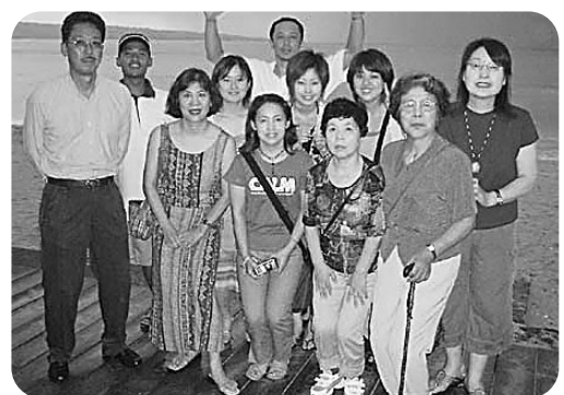
海が見えるレストランで食事を前にして

画の鑑賞はとても印象的でした。遠近法や陰影などバリエーションが豊富で、そして華麗なバリ舞踊であるパロンダンスとケチャックダンスを観ました。バリ舞踊の特徴は相対概念を果して無き戦いで表現するもので、特にケチャックダンスは海から陸に魔物が上がって来ないように祈る儀式で、男達の力強い声が響き渡っていました。