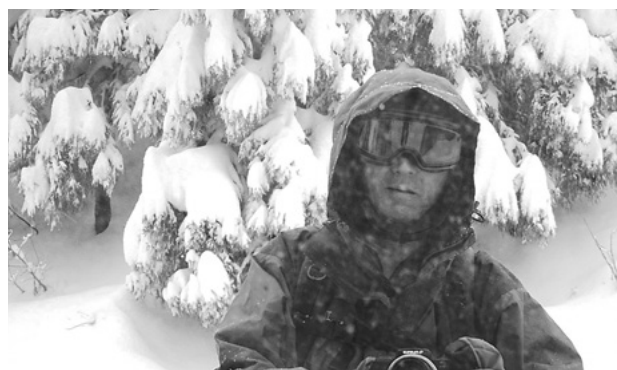
林道ミラーで記念写真

冬、医王山に行くときは大抵天気が荒れていることが多い、と言うのは悪天候でも医王山なら遭難することもないし、ちよつぱらトレッキングには最適だからである。と言