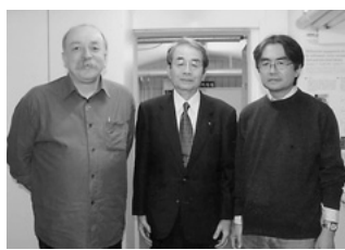
フンメル教授(左)と共に (ドレスデン大学耳鼻科にて)

日曜日であるのに、ドレスデン大学の耳鼻科の嗅覚センター所長のフンメル教授が、われわれのために出勤して待っていてくれるようにであった。