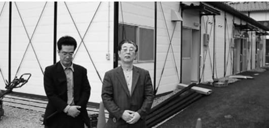
急ピッチで建設中の仮設住宅前にて

●去る3月25日に発生した能登半島地震の際に、たくさんのお見舞いならびに応援・励ましのお言葉を賜りまして、本当にありがとうございました。突然の災害のショックは大きなものではありませんでしたが、その中で見つけたもの、気づかされたことが、たくさんありました。あたりまえに生活できることがいかに幸せかというのもそのひとつです。今、町は多くのひとの力をかりて復興がすすめられています。私たちもこれから心を新たに、家族・地域のみならず力を合わせて大好きな門前が元気になるよう頑張ります。取り急ぎお礼まで・・・(輪島市門前町・歯科会員) ●七尾地区では輪島市、穴水町に比べて少ないとはいえ、地盤の弱い所では全壊、半壊家屋が見られ、私どもの病院、クリニックの外周でも最大20センチの地盤沈下があり、埋設給排水管が至る所で破損し、現在、応急処置で繋いでいる状況でありまして、業者の手が回らず、本格的な修復には日が掛かりそうです。それでも、翌日から平常通り外来診療ができましたのは、不幸中の幸いと思っております。取り敢えず、書面にてお見舞いの御礼を申し上げます・・・(七尾市・医科会員)