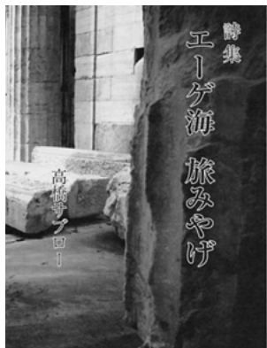
「エーゲ海 旅みやげ」