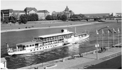
80年も変わらずに営業する エルベ川の観光蒸気船