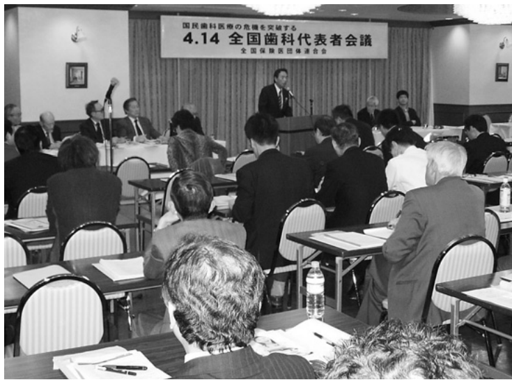
全国から108人が出席して開かれた全国歯科代表者会議 (4月14日/東京・虎ノ門パストラルホテル)

『国民歯科医療の危機を突破する全国歯科代表者会議』が、これまで経験したことのない参加者数と憤りに満ちて開催された。会議の基調を基調するならば、二つの意見に集約されるかもしれない。二つとも