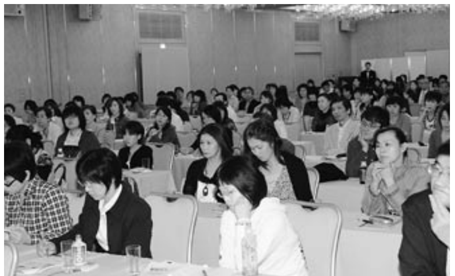
172人の医師・看護師・介護職の方々が熱心に学んだ (5月24日・金沢都ホテル)

五月二十四日(日)、金沢都ホテルにおいて「新しい創傷・褥創治療の実際」と題して、医師とコ・メディカルのための講演会が開催され、百七十二人が参加した。 このテーマに関して、数