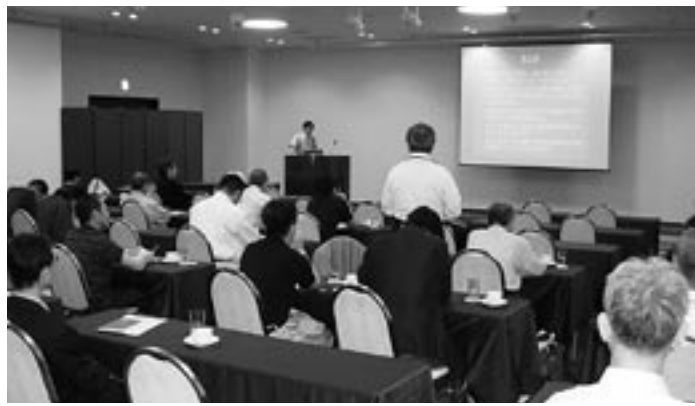
医科歯科一体の活動として全国からも注目されている講演会

論では、胃腸・大腸癌・肺癌・乳癌・肝臓癌について、おのおの基礎知識と詳しい治療法、抗癌剤の効果、また歯科医師の留意すべき点などについてお話をいただいた。随所に患者さんの立場に立った講師の人間性を垣間見たように思った。