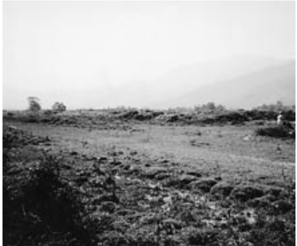
旧米軍の軍用飛行場があった Aloui Valley 枯れ葉剤を散布する飛行機が離着陸した

私のベトナムのかかりは、まさに今世紀になってからですので、まだ十年足らずです。この間、毎年一〜三回、計十三回訪問しました。専門は環境保健で、きっかけ