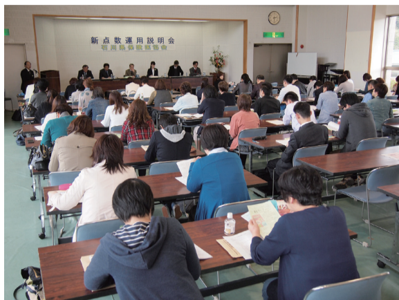
66人が参加した七尾会場 (4月29日・ワークパル七尾)