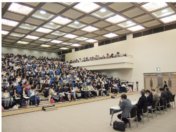
440人が参加した金沢会場 (4月29日・石川県地場産業振興センター)