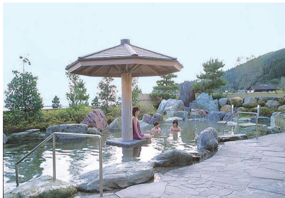
ひよっこり温泉の露天風呂は超開放的。目の前に広がる七尾湾はまるでパノラマ写真。こんな贅沢はなかなかできない

三つ目は露天風呂から見るその眺望だ。開放的と言え、その通りだが、少々気が引けるほどオーブン。女性は抵抗があるかもしれない。眼前に広がる七